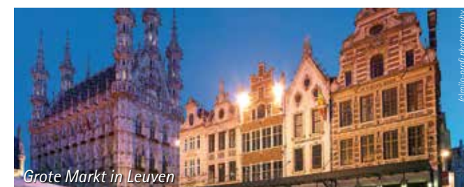
Grote Markt in Leuven