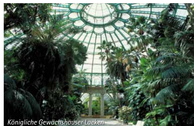
Königliche Gewächshäuser Laeken