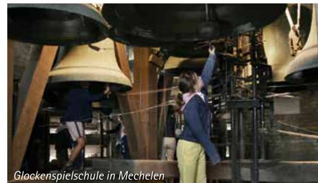
Glockenspielschule in Mechelen

JAN-JUN/SEP-DEZ: Aufpreis für die Nächte Mo-Do: € 29,- p.P.p.N. im DZ und € 55,- p.P.p.N. im EZ. Feiertagstermine auf Anfrage.