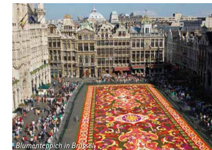
Blumenteppeich in Brüssel

Termin/e _____ Firma _____ Ansprechpartner _____ Tel. _____ E-Mail _____