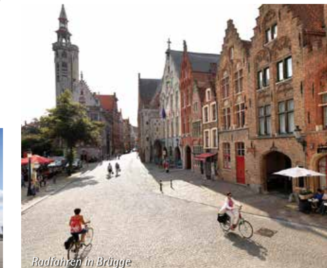
Radfahren in Brügge

Aufpreis für die Nächte Fr+Sa: € 6,- p.P.p.N. Feiertagstermine auf Anfrage und gegen Zuschlag.